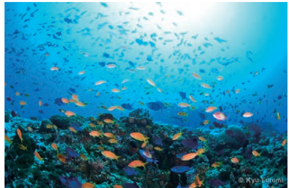
【ブルーオーシャン】 強い競争相手が不在で、競争の無い穏やかな市場。 敵のいない、独占できる青い海。

ブルーオーシャンを見つけられる確率は、1/10程度。割と簡単です。しかし、ブルーオーシャンを手に入れる確率は、1/10万ほどに低下します。1/10の高確率ブルーオーシャンを発見できるが、到達確率は