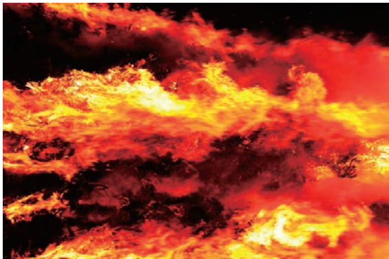
【レッドオーシャン】 競争が激しい燃え盛る激戦区。 火の海。

前「宝島」という物語に子供時代の筆者は夢中でした。少年が海賊船に紛れ込み、時にリンゴの樽に潜み、時に人の言葉を話す鳥を味方につけ、宝を見つける冒険譚。ヒミツの地図を読み解くなど解きと少年の冒険にワクワクしました。