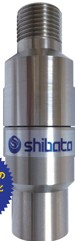
写真はほぼ原寸大