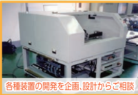
各種装置の開発を企画、設計からご相談