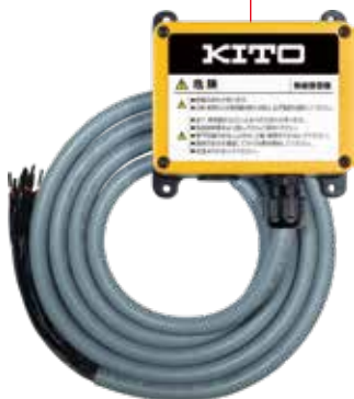
受信機 (2.2mケーブル標準付属)