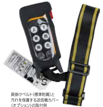
肩掛けベルト (標準付属) と汚れを保護する送信機カバー (オプション) の取付例

使用時間、乾電池やバッテリーの交換・充電頻度、使用環境に合わせて選択が可能です。