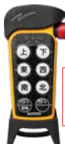
送信機セット (乾電池標準付属)