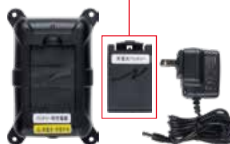
バッテリーキット (充電器/バッテリー/ACアダプター標準付属)