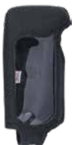
送信機カバー (オプション)