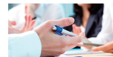
導入支援コンサルティング アセスメントサービス

Y's-Eyeは、検査品質の安定化・省人化を支援するAI画像判定サービスです。NG品を排除するための排除機構と連携させて、さらなる自動化を実現することも可能です。