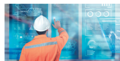
スマートファクトリーソリューション Y's-SF

工場設備のIoT化とAI分析を活用した、次世代ものづくりの実現を支援するMESを中心とする製品群で、お客さまのものづくりの競争力強化を支援いたします。