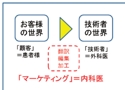
図2 お客様の世界から技術者の世界へ～マーケティングの役割