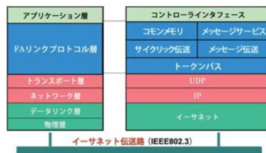
図2. FL-netプロトコル階層モデル

FL-netは、物理層/データリンク層にイーサネットを、トランスポート層にはUDP/IPを使用し、その上位にFL-netで定義したFAリンクプロトコルを実装する構成となっている。(図2、表1参照)