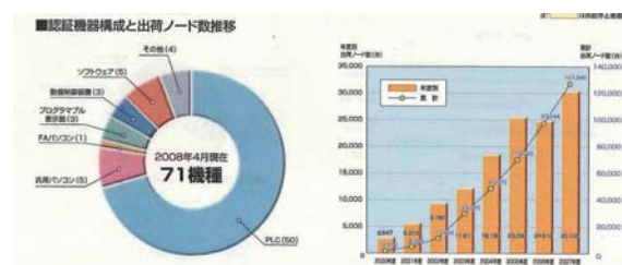
図3. 認証機器構成とFL-net出荷ノード数推移

FL-netの認証機器は国内において他のコントローラレベルネットワーク製品より数・機種も多く用意されている。プログラマブルコントローラ製品では19メーカーで50機種が用意されている。その他パソコン用ボード・表示器・数値制御装置やソフトウェアなど71機種の製品が認証を受けている。2007年度の集荷実績は、ハードウェア製品とソフトウェア合計で30,105ノード(前年比123.0%)と大幅に伸びを示している。これまでの累計ノード数は127,349ノードとなり120,000ノードを突破している。(図3参照)